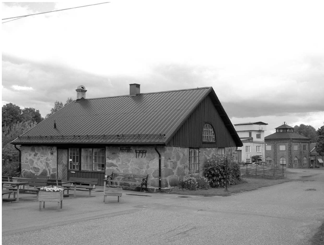
BILD 1. F.d. snickeriverkstad från 1799, Vikmanshyttan, Hedemora. Numera del av Vikmanshyttans muséum.